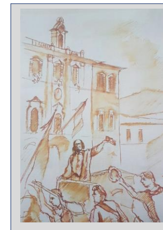
Garibaldi a Rieti – (A. Melchiorri)