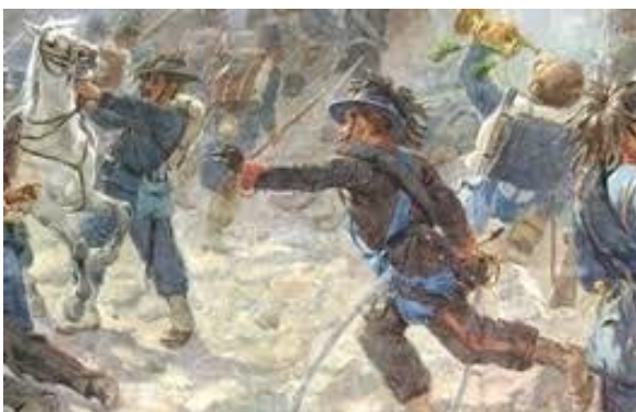
20 settembre 1870 – Bersaglieri a Roma