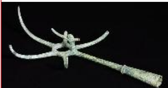
In basso, corredo di un principe sabino.

Comunque, di solito, laddove ci sono tombe non si può custodire, qualche preesistenza significativa si può invece valorizzare. Per noi, ripeto, non esistono problemi in tal senso, però non è che si può ricominciare daccapo dopo dieci anni, dopo dieci anni si possono fare le modifiche che è possibile fare. Un esempio è il caso della bretella: per creare minore impatto gli ingegneri del Politecnico di Torino l'avevano progettata sopraelevata, l'ideale per quel tipo di terreni, il comune, con alcuni cittadini, ha scelto invece di farla scorrere al livello del terreno e così abbiamo rimodificato il progetto. Ma non è finita qui, e non lo dico per fare polemica: ad un certo punto, qualcuno di questi tecnici esterni del Comune ha cambiato di nuovo idea, una volta per tutte si deve sapere che, appaltati i lavori, non si può tornare indietro. Al di là di quanto detto, sa che cosa evidenzerei invece se fossi un giornalista? Mi chiederei come si fa a pensare un'opera pubblica nel 2000 e realizzarla nel 2010-2011-2012... E come possano durare così tanto le indagini archeologiche, sono passati già due anni! Io credo che vadano fatte, ma sono questi i tempi? ».