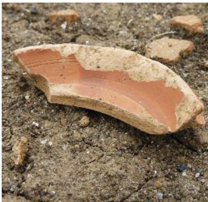
Sopra, evidenti resti di vasellame.

Comunque, di solito, laddove ci sono tombe non si può custodire, qualche preesistenza significativa si può invece valorizzare. Per noi, ripeto, non esistono problemi in tal senso, però non è che si può ricominciare daccapo dopo dieci anni, dopo dieci anni si possono fare le modifiche che è possibile fare. Un esempio è il caso della bretella: per creare minore impatto gli ingegneri del Politecnico di Torino l'avevano progettata sopraelevata, l'ideale per quel tipo di terreni, il comune, con alcuni cittadini, ha scelto invece di farla scorrere al livello del terreno e così abbiamo rimodificato il progetto. Ma non è finita qui, e non lo dico per fare polemica: ad un certo punto, qualcuno di questi tecnici esterni del Comune ha cambiato di nuovo idea, una volta per tutte si deve sapere che, appaltati i lavori, non si può tornare indietro. Al di là di quanto detto, sa che cosa evidenzerei invece se fossi un giornalista? Mi chiederei come si fa a pensare un'opera pubblica nel 2000 e realizzarla nel 2010-2011-2012... E come possano durare così tanto le indagini archeologiche, sono passati già due anni! Io credo che vadano fatte, ma sono questi i tempi? ».