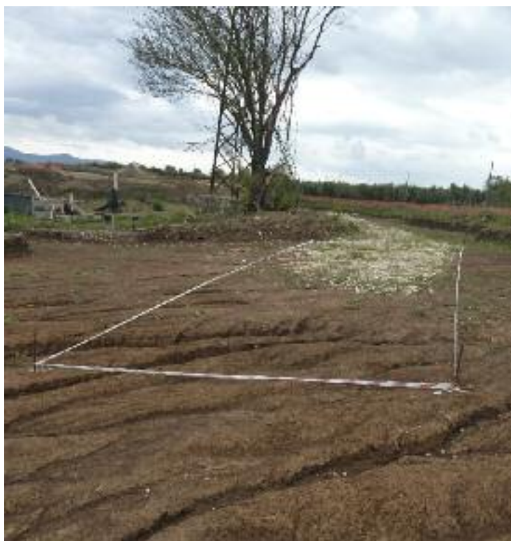
Sembra evidente l'esistenza di una strada romana

lo sviluppo dell'area da età protostorica alla fine dell'età antica, quadro poi arricchito dai rinvenimenti avvenuti successivamente soprattutto ad opera della British School at Rome. Oltre a Cures Sabini, il centro più importante della Sabina Tiberina almeno a partire dal VII secolo a.C. (tanto da entrare nelle leggende sulle origini di Roma come patria di Tito Tazio e Numa Pompilio), il territorio si presentava ricco di insediamenti agricoli. Tra questi – dalla seconda metà del II secolo a.C. – si distinguono numerose villae attestate da ruderi ancora in piedi e con materiali che manifestano un notevole livello di ricchezza. Lo smercio dei prodotti sul mercato di Roma era realizzato attraverso una capillare rete stradale, che in parte è stato possibile ricostruire, collegata con la grande via d'acqua costituita dal Tevere, che a varie riprese, anche in epoca moderna, ha svolto un'importante funzione di collegamento (ricordo che, prima degli anni Ottanta del secolo scorso, era ancora in funzione, a monte dello sbocco del Torrente Farfa nel Tevere, un traghetto, ultimo re-